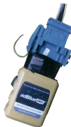
Émulateur amovible

Devant l'ampleur du phénomène, le Ministère des Transports a formé les contrôleurs des transports terrestres des DREAL et les a doté de valises de diagnostic pour la recherche des modifications illégales apportées aux véhicules. Lorsque la fraude est détectée, au-delà de la sanction pénale prévue par le code de la route (C. route : art. L.318-1 / art. L.318-3/ art. R.318-1), le contrevenant voit également son véhicule immobilisé jusqu'à la remise en conformité du système antipollution. A ces sanctions, il faut ajouter le coût des réparations qui peut s'élever à plusieurs milliers d'euros.